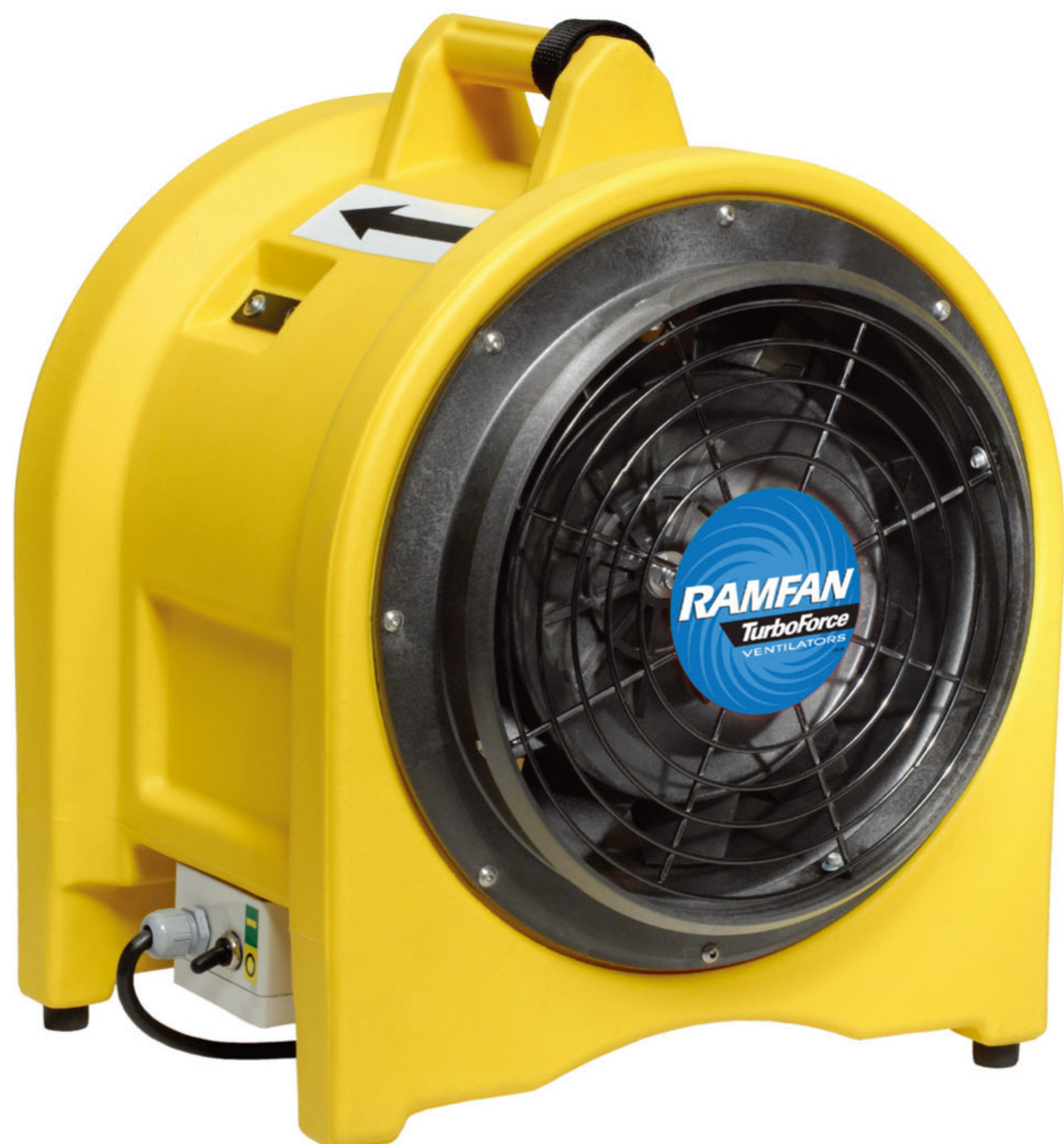
强大的竞争力/性能图表